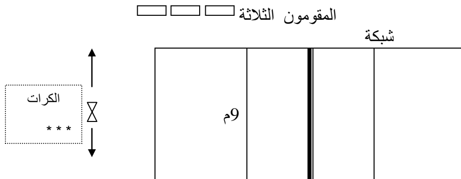
الشكل (2): يوضح تقويم الاداء الفني (التكنيك) لمهارة الارسال الساحق بالكرة الطائرة