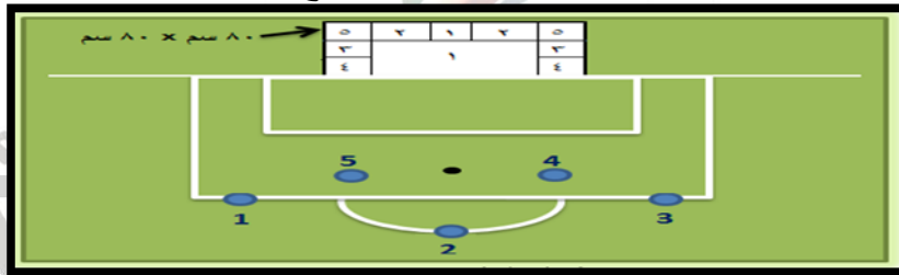
الشكل (3) يوضح اختبار مهارة التهديف بكرة القدم

الغرض من الإختبار: قياس دقة التهديف بعدد من الكرات نحو هدف مقسم على مربعات. الادوات المستخدمة: ملعب كرة القدم، شريط لتحديد منطقة التهديف للاختبار، (5) كرات قدم توضع في أماكن محددة من منطقة الجراء، كما موضح في الشكل (3). وصف الاداء: يقف المختبر خلف الكرة رقم (1) وعندما تعطى إشارة البدء يصوب الكرة إلى المرمى بوجهه أو بداخل القدم الأمامي ثم يكرر التصويب بالكرة رقم (2) وهكذا حتى ينتهي من تصويب الكرة رقم (5) على أن يأخذ الطالب الوقت الكافي المناسب لتنفيذ التصويب. التسجيل: تحتسب الدرجة بمجموع الدرجات التي يحصل عليها المختبر من تصويب الكرات الخمس بحيث تنال كل تصويبه الدرجة المحددة في كل منطقة التي تذهب إليها الكرة على أن تحتسب خطوط التقسيم ضمن المنطقة الأعلى درجة، ويراعى أن التصويب خارج حدود المرمى تكون درجة صفر.